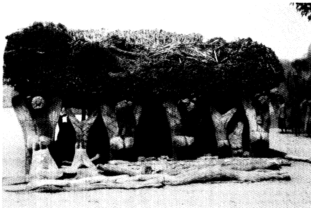
Togu'na - Falaises de Bandiagara (Mali)