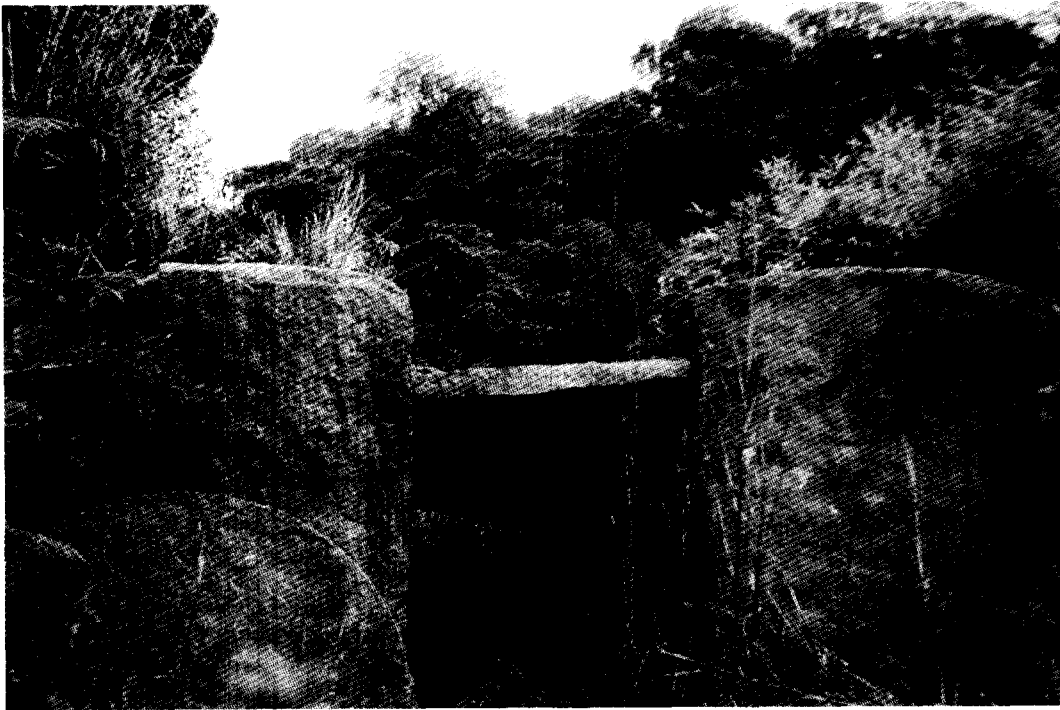
Vue extérieure ouest du portail d'Andakana - Colline royale d'Abohimanga (Madagascar), 1999.

Western exterior view of the Andakana gate - Royal Hill of Abohimanga (Madagascar), 1999.